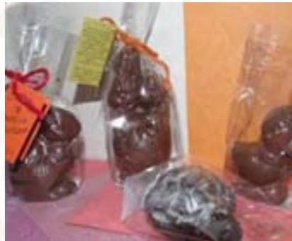
FIGURE DI CIOCCOLATO – Anche quest'anno vengono riproposte le FIGURE PASQUALI, confezionate con un involucro trasparente, abbellite da un cordino in iuta di Creation del Bangladesh e da un foglio in caccia d'elefante della cooperativa Maximus dello Sri Lanka.